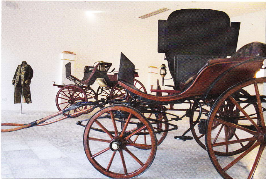
Una veduta della sala del museo

Nel 1783, dopo il grande flagello che colpì la Calabria Ulteriore (la Calabria era divisa in due entità amministrative: Calabria Citra o latina e Calabria Ulteriore o greca, di quest'ultima ne faceva parte l'attuale provincia di Reggio Calabria), il Marchese Nicola, a sue spese, fece canalizzare lo scolo del cosiddetto Lago di Sitizano. Questo si era originato per effetto del devastante terremoto e le sue acque malsane portavano disagi e malattie alla popolazione residente ed inoltre il Marchese bonificò le campagne circostanti, approfondendo le sue risorse personali.