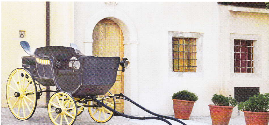
L'esterno del museo

Sono otto le vetture che costituiscono la collezione, fabbricate anche da note carrozzerie dell'epoca, provenienti dall'Italia e dalla Francia, che dopo un attento restauro eseguito con perizia si presentano al pubblico. Della collezione fanno parte delle Berline, uno dei modelli che ebbe maggiore diffusione. Era impensabile nel Settecento partecipare alla vita pubblica senza l'ausilio di questo mezzo per via dei frequenti spostamenti. Altri esemplari significativi della collezione sono rappresentati dal Landau, un modello che nell'Ottocento era molto diffuso sia presso l'aristocrazia che l'alta borghesia, facilmente decappottabile grazie alla parte superiore dotata di pareti in cuoio a forma di mantice e numerosi modelli di calesse usati principalmente per le attività agresti.